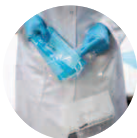
Version 2 gants